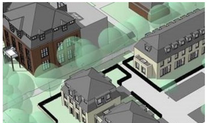
Op de plek van de bunker staat woningbouw gepland.

Wij verwachten dat we dit jaar intensief contact hebben met de gemeente en de projectontwikkelaar en zullen u steeds op de hoogte houden van de plannen en zo mogelijk betrekken in de ontwikkelingen.