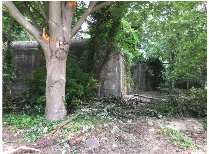
De afmetingen van deze kolossale bunker: 12,5 x 17,75 m + 2 zijflappen van 3.00 meter, hoogte: 5 meter

Wij hebben zelf een sloopfirma benaderd die ter plekke heeft geconstateerd dat het mogelijk is om de bunker 'geluidsarm' te zagen. Met deze wetenschap hebben we de projectontwikkelaar benaderd om hem op andere gedachten te brengen. Na de aankondiging van deze brief en het verhaal van de 'bunkerzager' heeft de